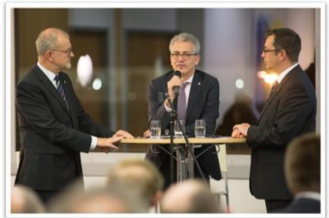
Gedankenaustausch mit dem Hessischen Verkehrsminister Tarek Al-Wazir